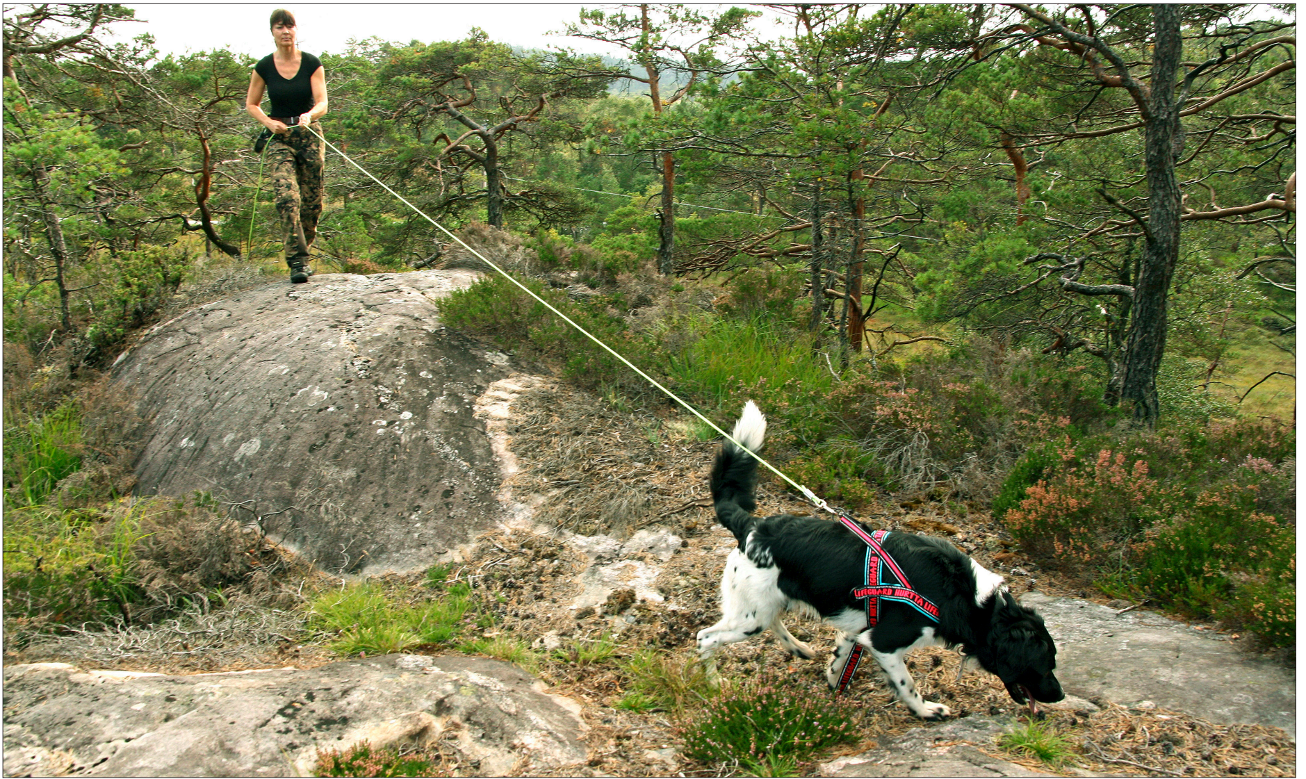
PÅ SPORET: Storm jobbar seg målretta fram langs blodsporet mot hjortefoten som eigar Helga-Mari Tessem har plassert ut i Sveio-skogen.